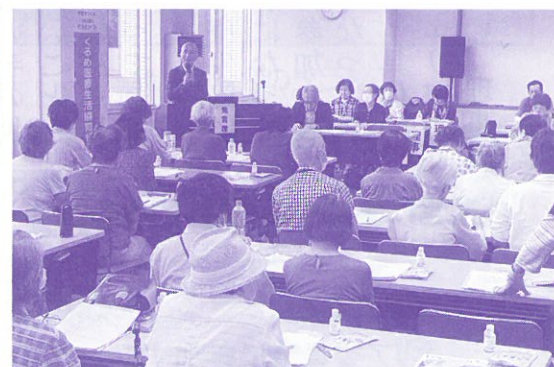
昨年の総代会の様子

ツク組合員交流研修会の計画もあります。活発な論議で総代会を成功させ、多くの組合員に医療生協の取り組みを広げていきたいと思います。