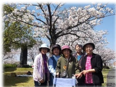
各エリアで 花見班会