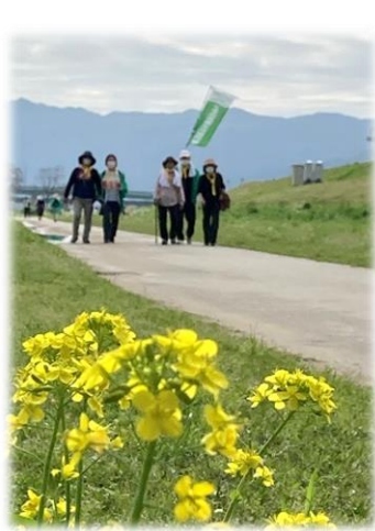
てくてくウォーキング