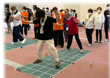
九沖ブロック組合員交流研修