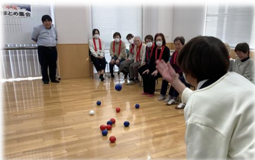
強化月間まとめ集会 みんなでボッチャ