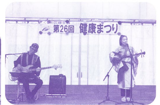
三線ロビンズさんによる 沖縄民謡など