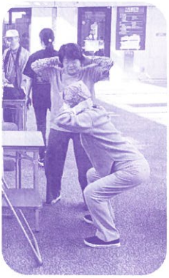
スクワットなど 効果的な筋トレの方法