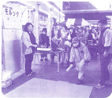
ポッチャやモルックなどニュースポーツ体験 子どもも大人も大はりきり！