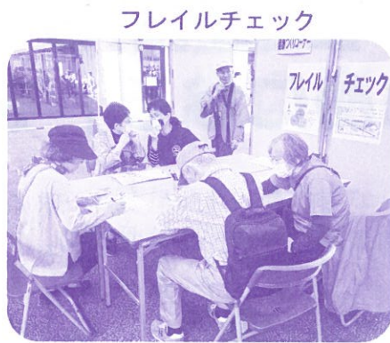
フレイルチェック