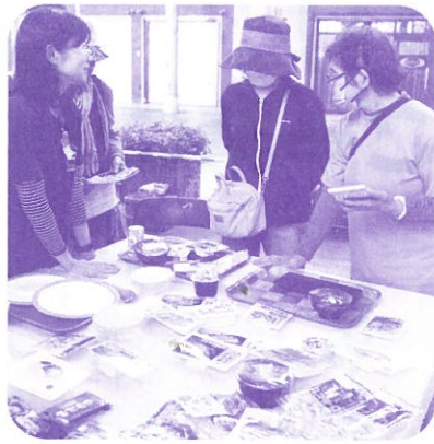
たんばく質 たっぷり