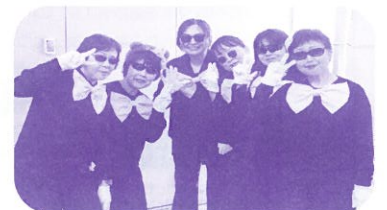
クリニック職員の ステップカラオケ