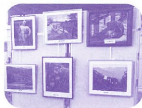
力作ぞろいで来場者の目を楽しませた