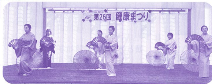
組合員さんの趣味や特技を披露 バラエティあふれるステージに

くるめ医療生協 久留米市南 2-5-12 TEL0942-21-8300 組合員数 4,036世帯 平均出資額 28,454円 (10月末日現在) 年12回発行