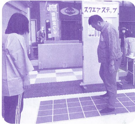
頭と体を使って認知症予防 スクエアステップ