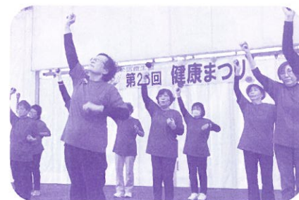
エンディングはお手玉体操 「また逢いましょう お元気で」