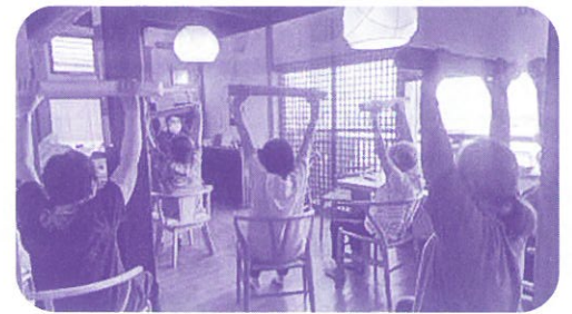
ストレッチ体操など