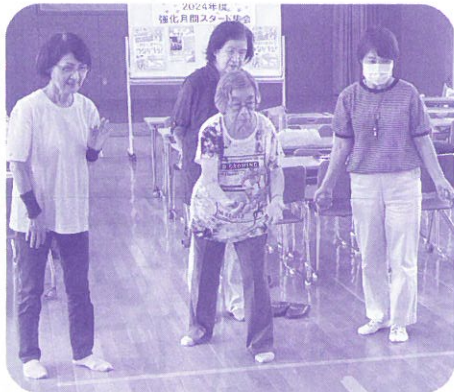
狙いを定めて、緊張の瞬間。

楽しく健康づくり・仲間づくり 楽しく健康づくり、仲間づくりをすすめるべく、ポッチャやスクエアステップのニュースポーツを体験しました。いずれのスポーツも、身体的能力に関わりなく参加でき、脳トレを組み合わせたスポーツです。ボールが思ったところに飛ばなかったり、リズムが合わなかったり、失敗も楽しく、笑顔が溢れました。(参加者の感想) *スクエアステップは難しく考えていたが、難しさに段階があつて考えながら踏んでいくので、認知症の予防になる。楽しかった。 *エリアそれぞれの取り組みが知れて良かった。 *ニュースポーツは楽しかった。みんなと盛り上がり良かった。