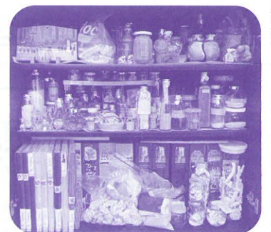
↑戸棚を埋め尽くす宝物