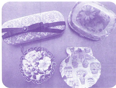
めがねケースや石けんなど様々な素材にデコパージュ。無地のトートバックもおしゃれに大変身。