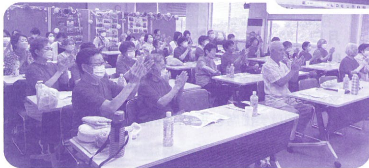
参加者を歓迎して、ステップカラオケを披露