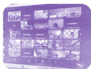
昨年はくるめ医療生協が主管となりオンラインで開催しました

参加費用の一部をくるめ医療生協と財政活動でまかない、自己負担額は14,000円を予定しています。参加希望の方は各エリア担当者または、くるめ医療生協本部までお問合せください。財政活動にもご協力をよろしくお願いいたします。(くるめ医療生協本部 0942-21-8300)